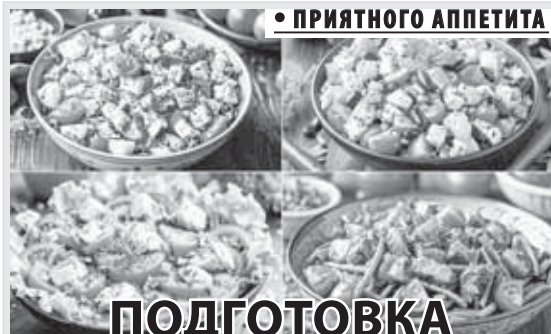
Фото Тамары Ардавовай