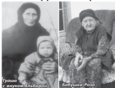
Гуаша с внуком Альборой