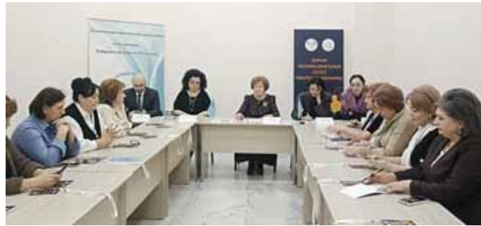
Центр культурного развития г.о. Нальчик стал площадкой для проведения форума межнациональных семей Кабардино-Балкарии, организованного региональным отделением Союза женщин России Кабардино-Балкарии. Проект реализуется при поддержке Министерства по делам национальностей и общественным проектам КБР.