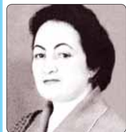
Ащхуэтым къыгуысыахэр Іаджри къагъэсэбэ