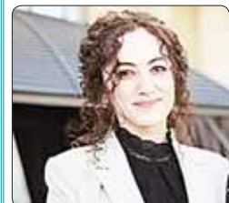
Пшэм щекіуэкі кІэхъуыкыщІэхэр къэзыгъэІурищІэ