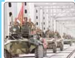
Тхыдэм и напэкіуэщІэ щхьэхуэ

Щэч къытесхьэркъым, социальнэ Іуэху- хэр дэгъэкІыным хуэгъэзауэ шыІэ иджы- рей Іэмалхэмрэ лэжкьэкІэщІэхэмрэ кэд- гъэсэбэлу, республикэм исхэм я псуақІэр зореддгъэфІэкіуэфрунум. ІуэхуфІ кудэ кърікіуэну дыпэпІэу щыІоддэ мы лэ- жыгъэм икІи псом хуэмйдуэ абыкіэ ди щІалэгъуалэм сащоугъ».