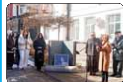
Къэшэж Иннэ и фэепІыым деж