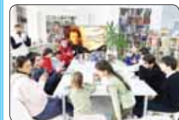
АІэщІыгуэхэр блжыш, Пушкинр псуақІ