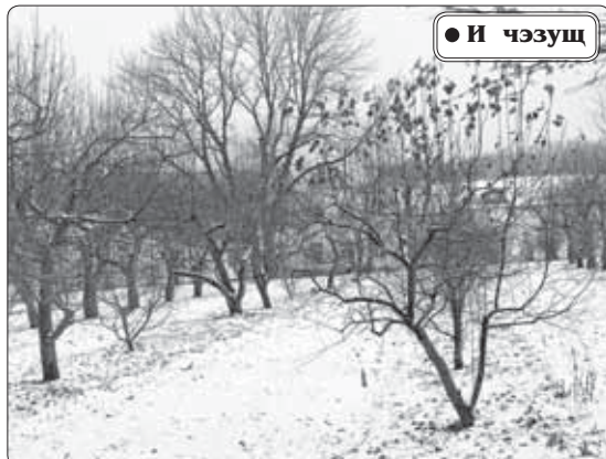
• И чӕзуш

Ауэ гъӕтхъэм дызӕлӕжӕ жыгым псӕ кыпӕкӕлӕн щӕлӕдзӕ-гъӕхъӕщи, хуабжӕу дахуӕсӕ-кыпӕлхъӕш. Фӕлӕн папщӕлӕ: кукӕкӕ зӕрылӕ кызыпӕкӕлӕ жыгым - баллий, шӕдыгъуей, кӕлӕ-нӕмыщӕлӕм - и кӕудамӕхъэм щыщу нӕхъ зӕран хуэр, гуӕр мыхъумӕ, нӕгуӕщӕлӕ гъӕтхъэм пыпхъ хъуажынукъым.